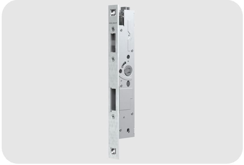
ASSA ABLOY OneSystem N1920 Panik Fonksiyonlu Pasif Kanat Gomme Kilit N1920