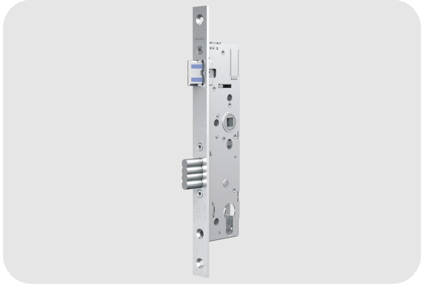
ASSA ABLOY OneSystem N16XX Dar Profil Panik Kilit Serisi