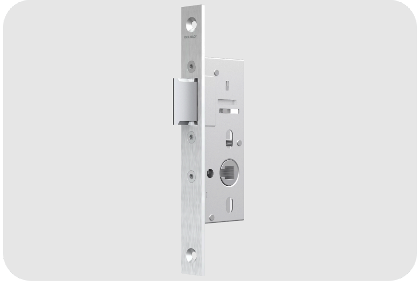
ASSA ABLOY OneSystem N1502 Dilli Gömme Kilit