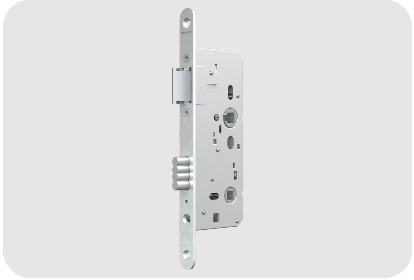
ASSA ABLOY OneSystem N1001 Wc Tipi Gömme Kilit