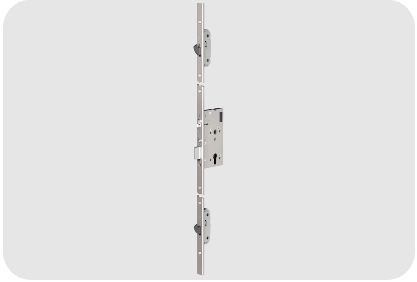
ASSA ABLOY MP520 Elektromekanik Motorlu Çok Noktalı Kilit