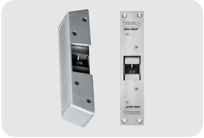
ASSA ABLOY TRIMEC ES6000 Elektrikli Kilit Karşılığı