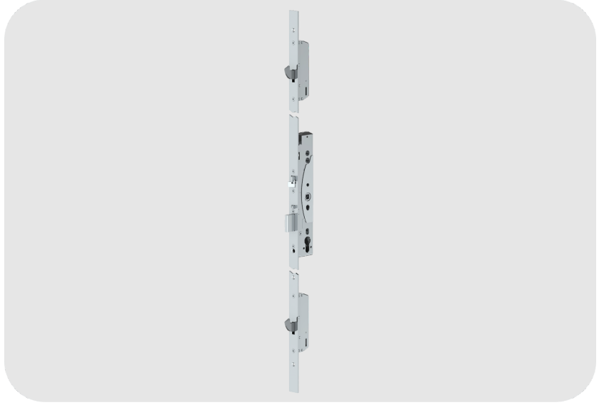
ASSA ABLOY EL466 Serisi Elektromekanik Solenoid Çok Noktalı Kilit