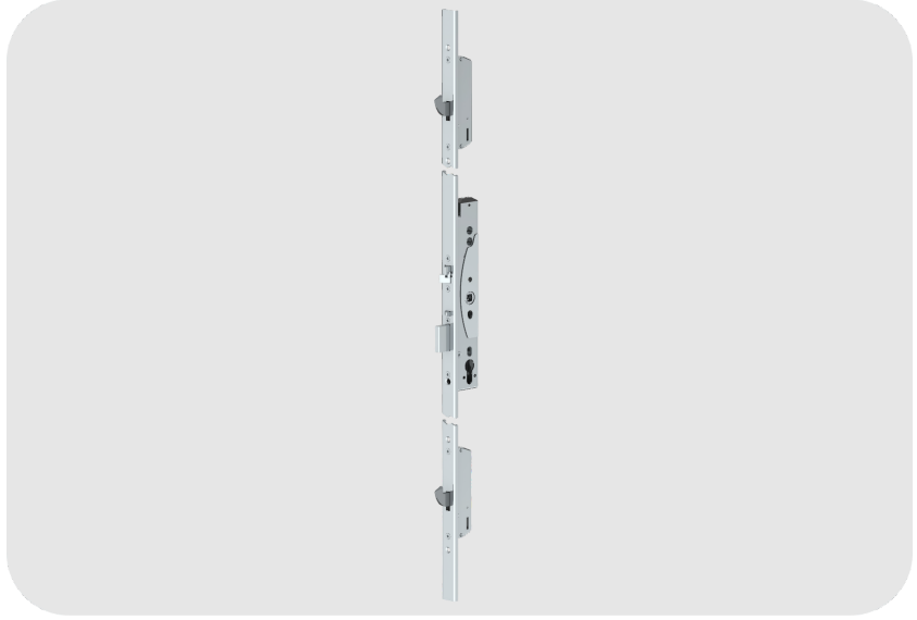
ASSA ABLOY EL066 Dar Profilli Kapılar İçin Mekanik Yüksek Güvenlikli DIN Standardı Çok Noktalı Kilit