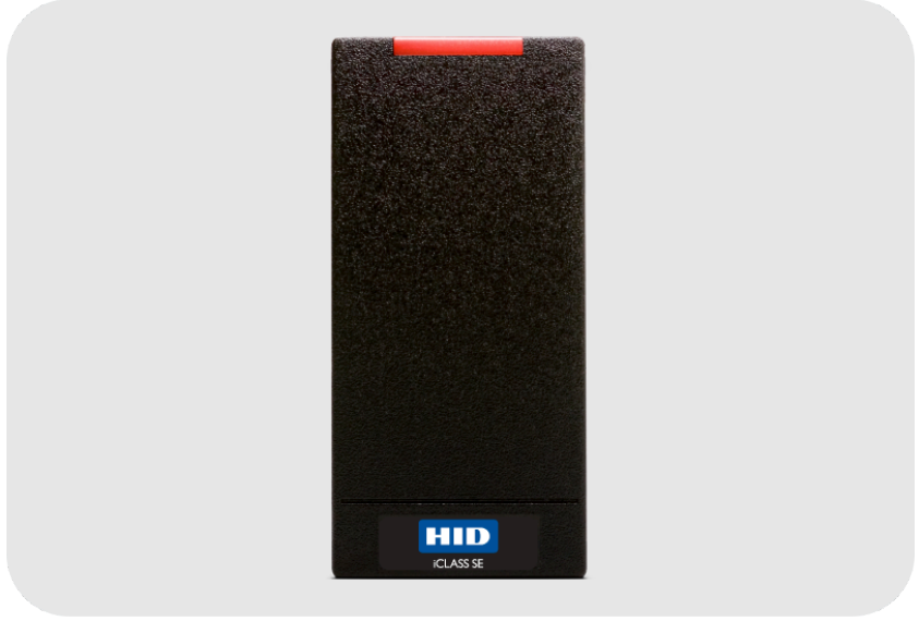
ASSA ABLOY HID R10 iCLASS SEOS™ Express Mobile RFID Okuyucu 13,56 Mhz Wiegand, bluetooth