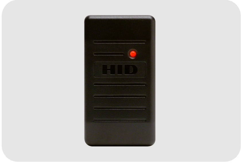
ASSA ABLOY ProxPoint® Plus Proximity Okuyucu 125 kHz