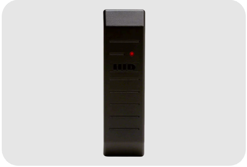
ASSA ABLOY MiniProx® Proximity Okuyucu 125 kHz