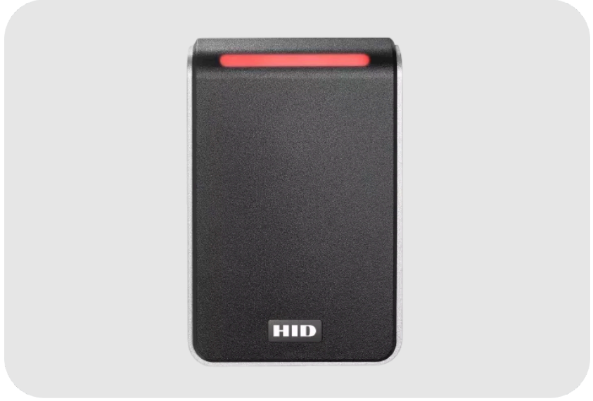
ASSA ABLOY HID Signo 40 Serisi Custom Profil Mobile Akıllı Kart Okuyucu