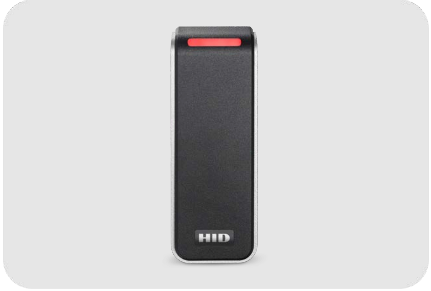
ASSA ABLOY HID Signo 20 Serisi Smart Profil Mobile Akıllı Kart Okuyucu