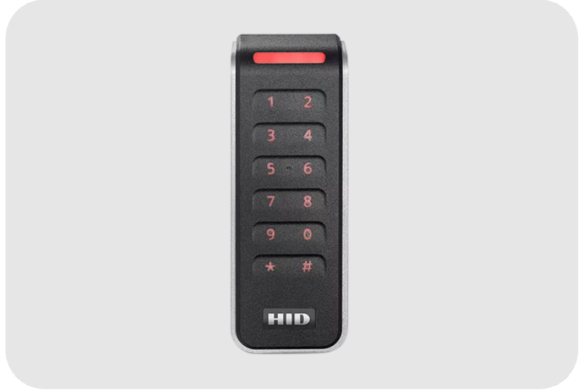
ASSA ABLOY HID Signo 20K Serisi Custom Profil Mobile Akıllı Kart Okuyucu 20KNKS-03-000000