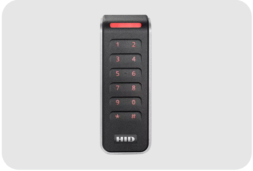
ASSA ABLOY HID Signo 20K Serisi Kapasitif 2x6 Tuş Takımlı Smart Profil Mobile Akıllı Kart Okuyucu 20KNKS-02-000000