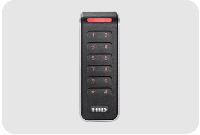
ASSA ABLOY HID Signo 20K Serisi Kapasitif 2x6 Tuş Takımlı SEOS Profil Mobile Akıllı Kart Okuyucu