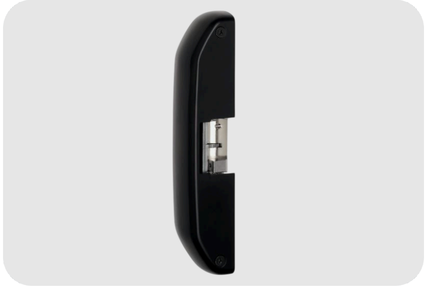
ASSA ABLOY eff-eff 14U400 Elektrikli Kilit Karşılığı