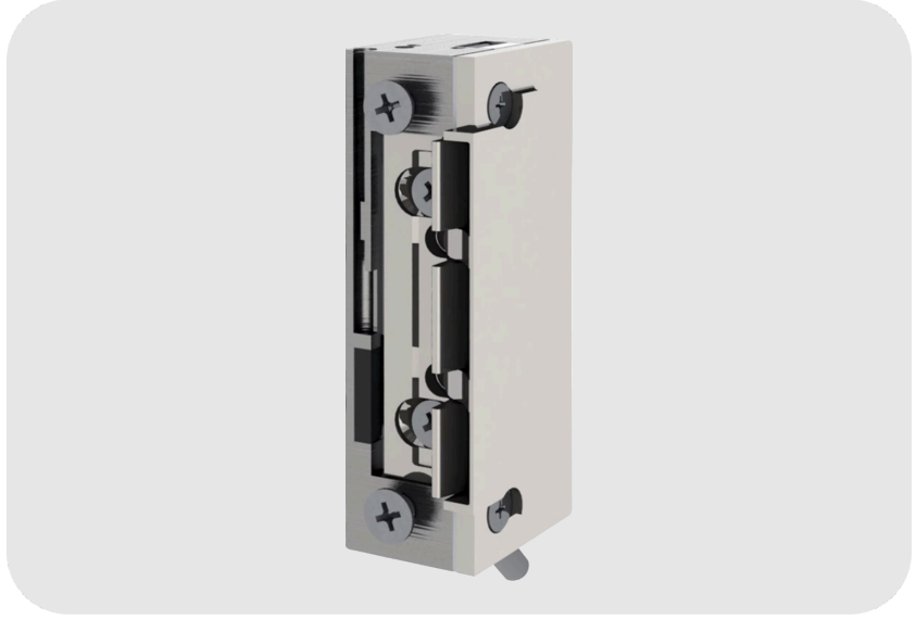
ASSA ABLOY eff-eff 118W Elektrikli Kilit Karşılığı