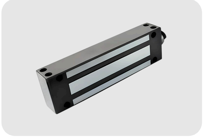
ADAMS RITE 540 Kg Tutma Kapasiteli Dış Ortam Manyetik Kilit