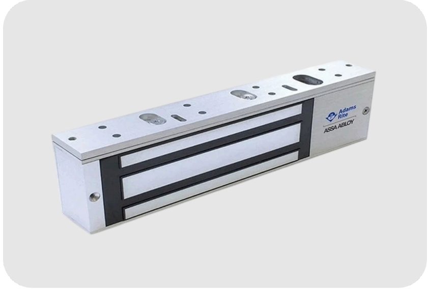
ADAMS RITE 281 Serisi Manyetik Kilit