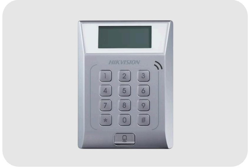
HIKVISION DS-K1T802E Proximity Kart Okuyucu