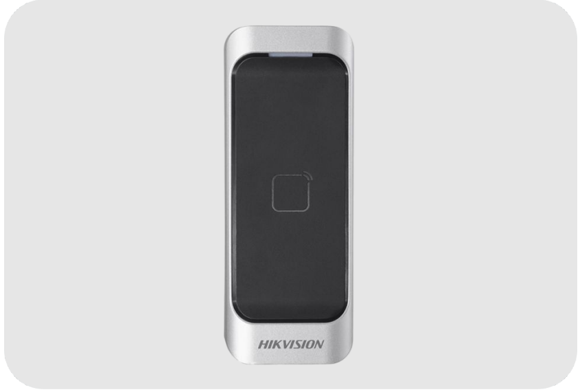
HIKVISION DS-K1107AM Mifare Kart Okuyucu